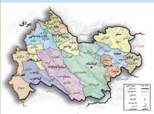
شکل ۱. موقعیت منطقه مورد مطالعه

جنوب به استان لرستان و ایلام، از شرق به استان همدان و از غرب به کشور عراق محدود می‌شود.